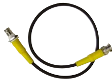
0,5 m Verlängerung für BNC-Antenne