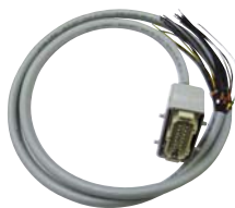
2 m-Kabel + Stecker 16-polig