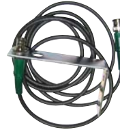
2 m Verlängerung für BNC-Antenne + Haltewinkel