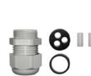
Satz PE M25 mit 2 Ringösen