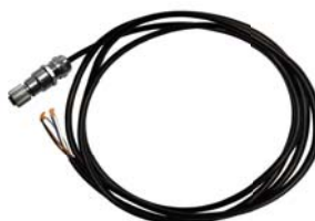
Rundsteckverbindersatz M12, 5-polig+ 2m Kabel