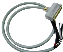
2 m-Kabel + Stecker 24-polig