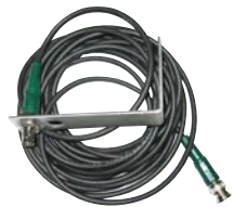
5 m Verlängerung für BNC-Antenne + Haltewinkel