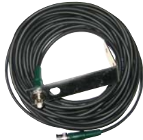
10 m Verlängerung für BNC-Antenne + Haltewinkel