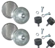
Transceiverbefestigungssatz mit magnetischer Unterlage