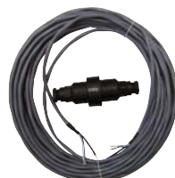
10 m Kabelverlängerung + Stecker,