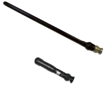
Stabantenne, 1/4 Welle, BNC